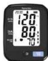
Monitores de Presión